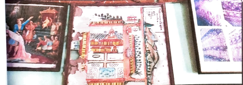
কমলাবাৰী সত্ৰৰ চাবিসীমাৰ মানচিত্ৰ