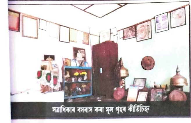
সত্ৰাধিকাৰ বসবাস কৰা মূল গৃহৰ কীৰ্তিচিহ্ন