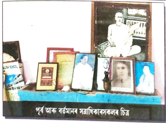
পূৰ্ব আৰু বৰ্তমানৰ সত্ৰাধিকাৰসকলৰ চিত্ৰ