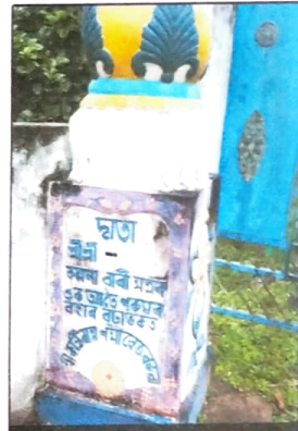
মূল প্ৰবেশকাৰী ভোৰণৰ সোঁ স্তম্ভ