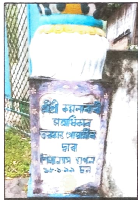
মূল প্ৰবেশকাৰী ভোৰণৰ বাওঁ স্তম্ভ