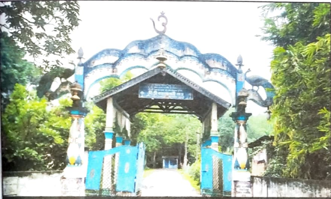
কমলাবাৰী সত্ৰৰ ভোৰণ