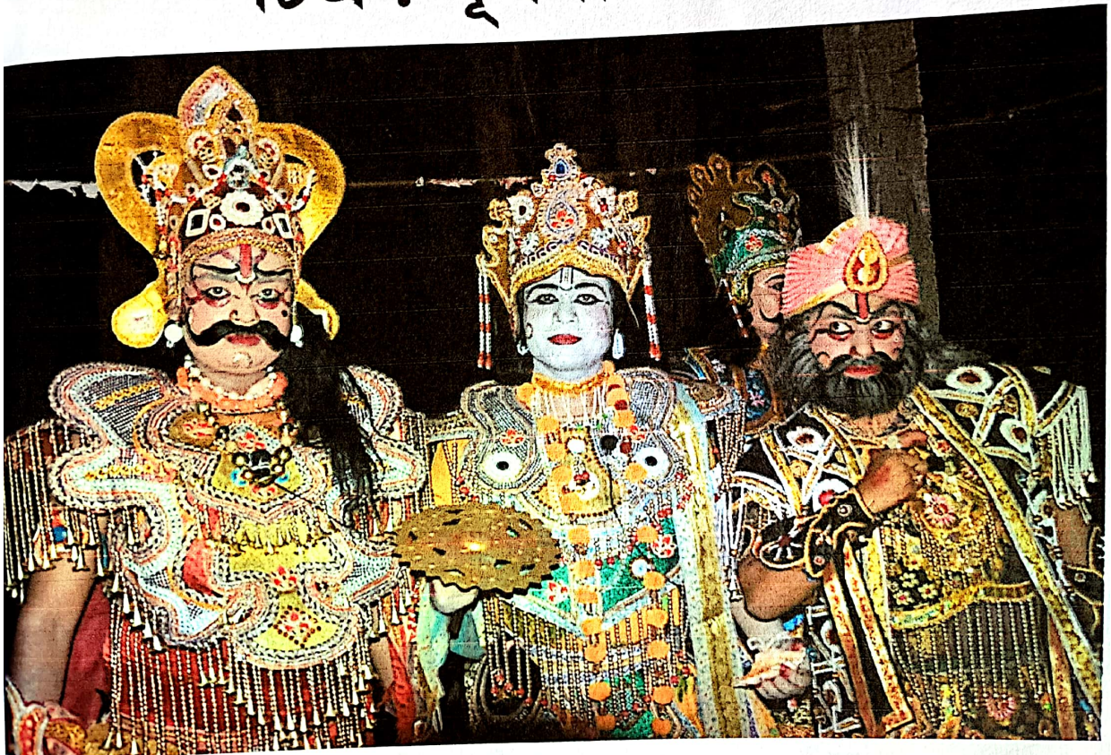
চিত্র : ভাৰৰীয়া