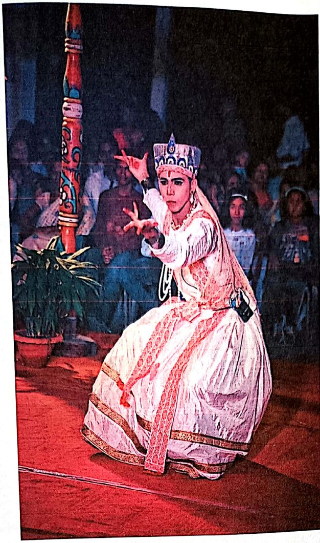
চিত্র : সূত্রধাৰ