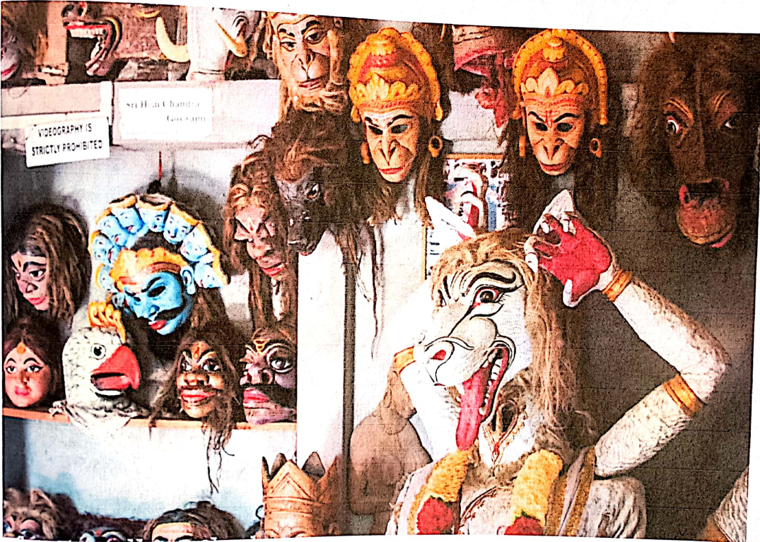
চিত্র: ভাওনাত ব্যৱহৃত মুখা